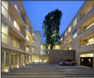
ディアナコート成城翠邸