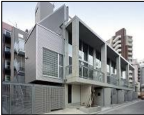
代官山プロジェクト