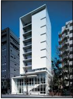
ネクストフォルム西麻布