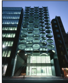
アルファマトリックス